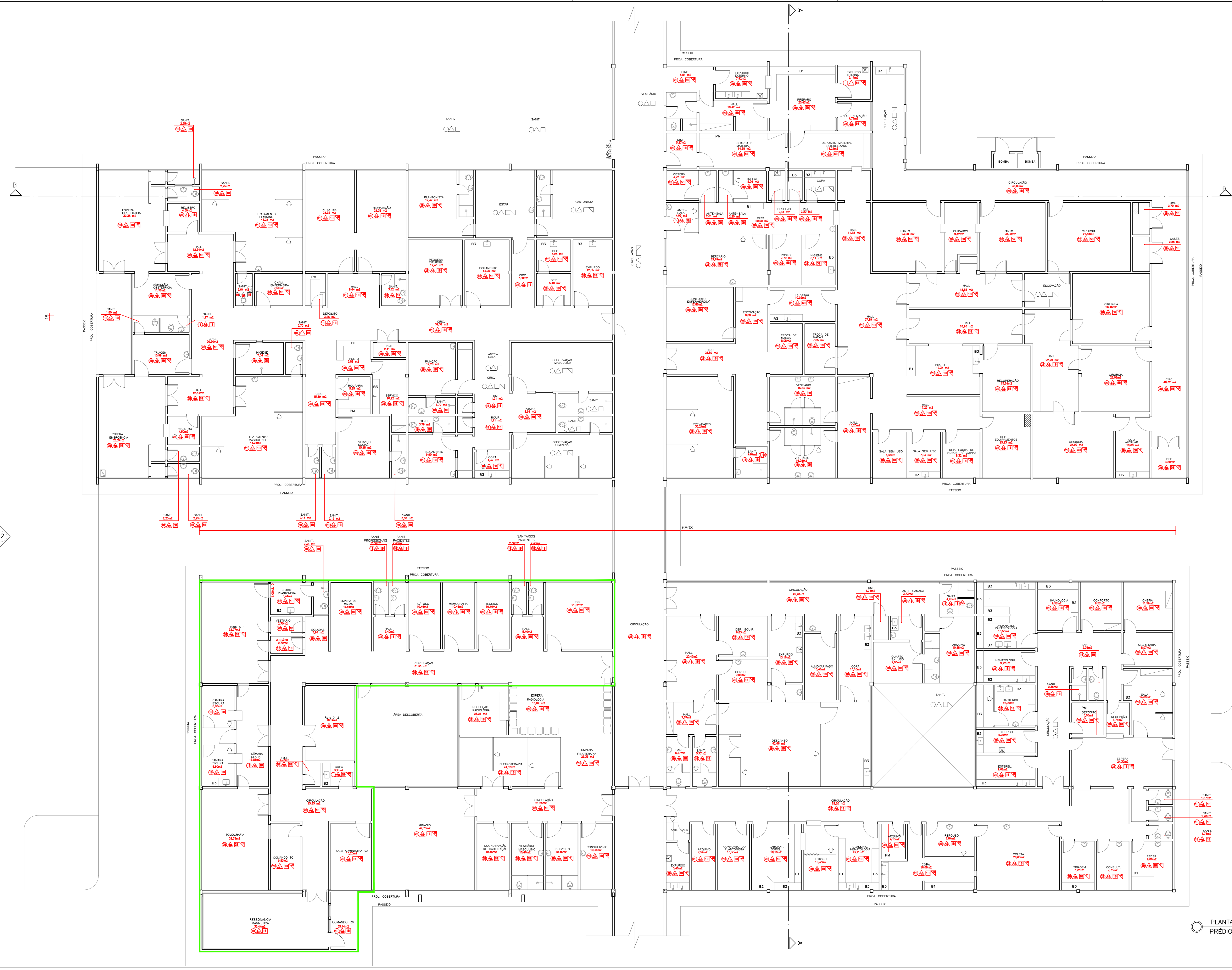
PLANTA BAIXA PRÉDIO PRINCIPAL – SETOR 02